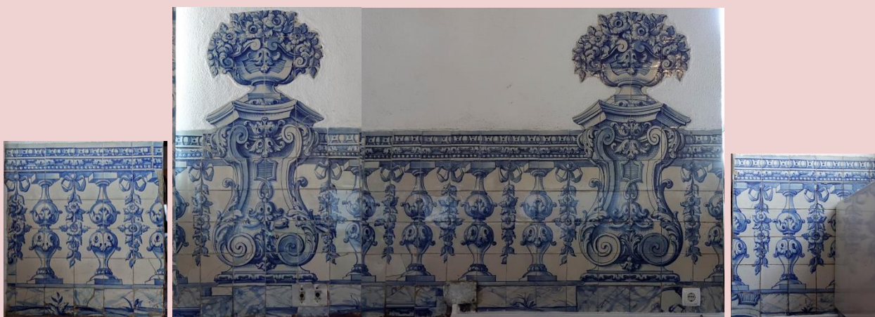
Imagem (s/escala) do Painel de Azulejos CSJ CL PI AZ 010

Data 31/07/2017 | Atualizado a 31/07/2020