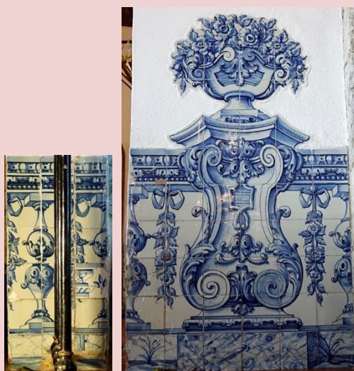
Imagem (s/escala) do Painel de Azulejos CSJ CL PI AZ 014

Planta interior do edifício Paço Real II (s/escala) - localização do painel: NA8 e NA9