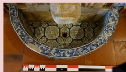
Imagem (s/escala) da Fonte CSJ CL PI FO 016

Data 31/07/2017 | Atualizado a 31/07/2020