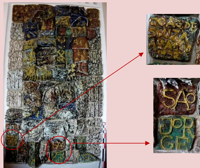
Imagem (s/escala) do Painel Cerâmico CSJ CL PIAZ 015

Planta interior do edifício Paço Real II (s/escala) - localização do painel cerâmico no Alçado Nascente.