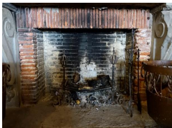
Imagem (s/escala) da Lareira CSJ CL PI LAR 0122