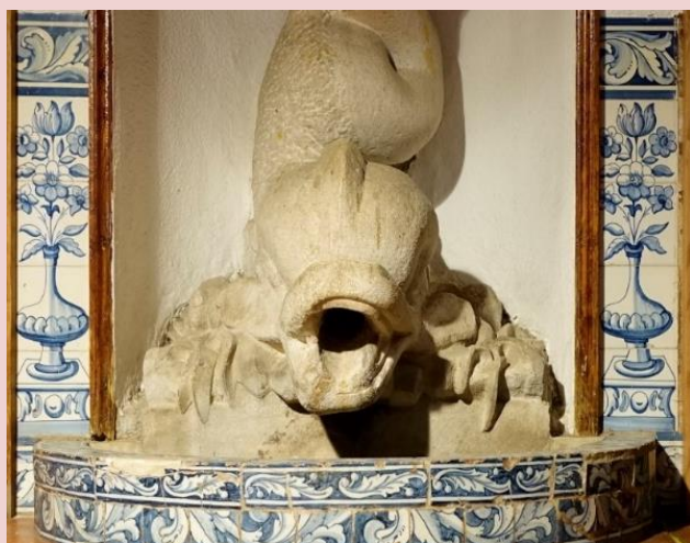
Imagem (s/escala) do Painel de Azulejos CSJ CL PI AZ 003

Data 28/07/2017 | Atualizado a 31/07/2020