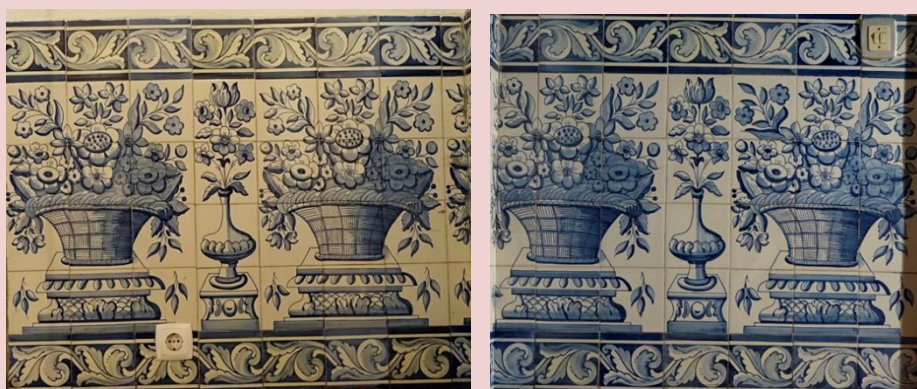
Imagem (s/escala) do Painel de Azulejos CSJ CL PI AZ 004

Planta interior do edifício Paço Real II (s/escala) - localização do painel: N0.3 e PO1