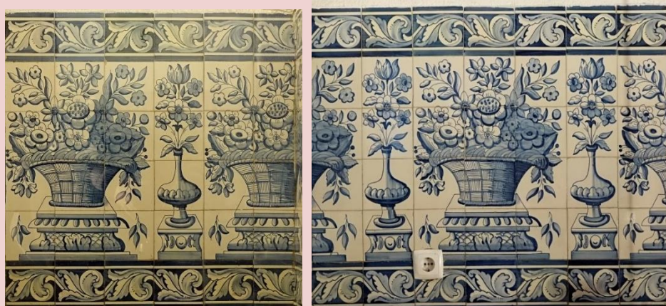
Imagem (s/escala) do Painel de Azulejos CSJ CL PI AZ 005

Data 31/07/2017 | Atualizado a 31/07/2020