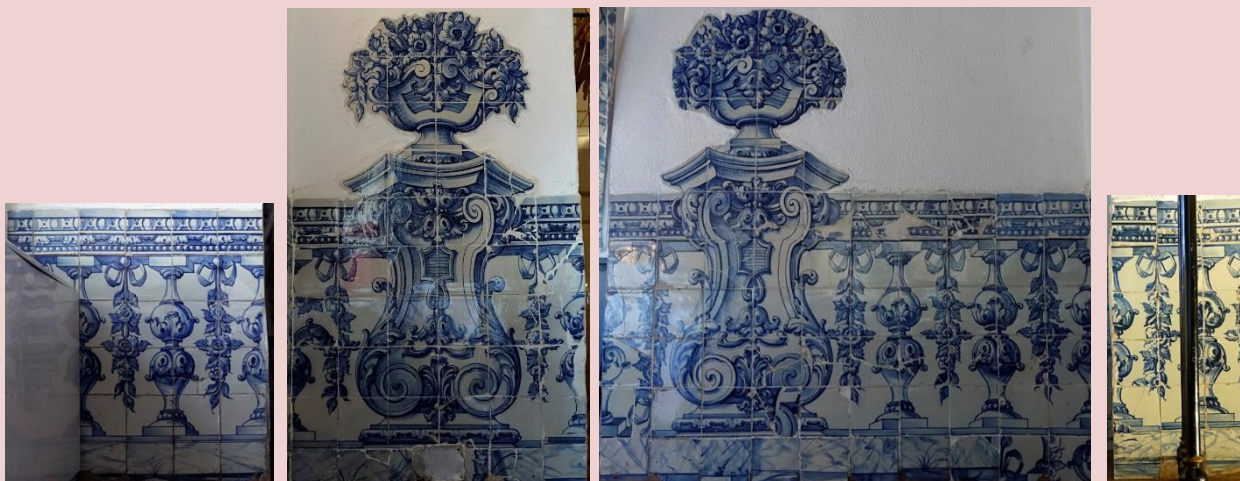
Imagem (s/escala) do Painel de Azulejos CSJ CL PI AZ 006

Planta interior do edifício Paço Real II (s/escala) - localização do painel: PO4 PO5 PO6 e PO7