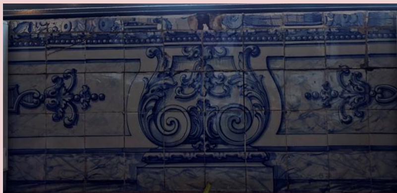
Imagem (s/escala) do Painel de Azulejos CSJ CL PIAZ 007

Planta interior do edifício Paço Real II (s/escala) - localização do painel: PO8