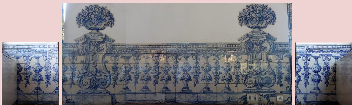
Imagem (s/escala) do Painel de Azulejos CSJ CL PI AZ 008

Data 31/07/2017 | Atualizado a 31/07/2020