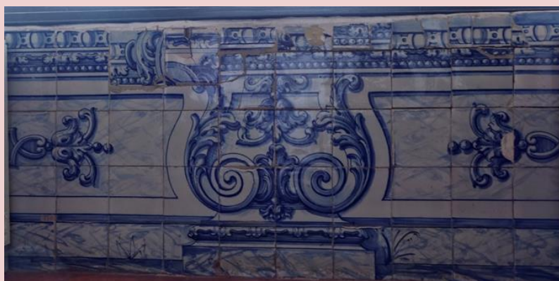
Imagem (s/escala) do Painel de Azulejos CSJ CL PIAZ 009

Planta interior do edifício Paço Real II (s/escala) - localização do painel: PO12