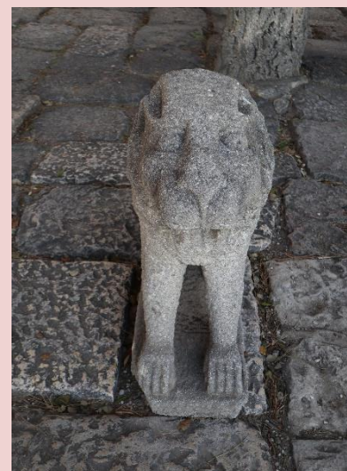
Imagens (s/escala) da estátuas CSJ 0006