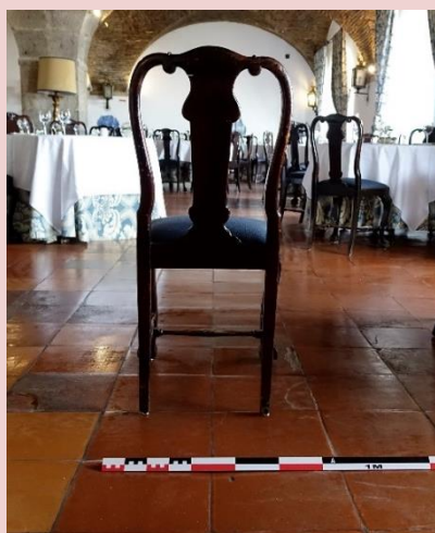
Imagem (s/escala) da peça de mobiliário CSJ CL PM MO 002

Data 31/07/2017 | Atualizado a 31/07/2020