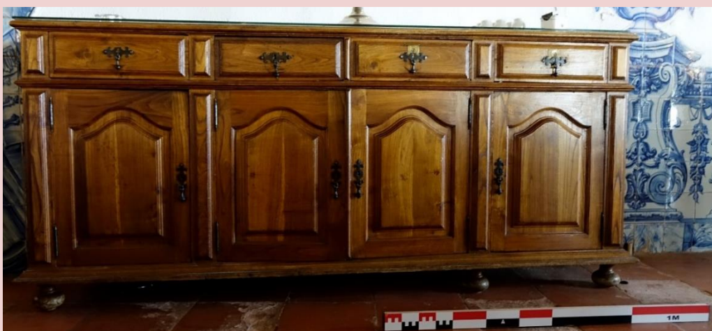
Imagem (s/escala) de uma das peças de mobiliário do conjunto CSJ CL PM MO 006

Planta interior do edifício Paço Real II (s/escala) - localização do conjunto de mobiliário no interior do Edifício Paço II. (Localização do património móvel aferida a 31/07/2017)