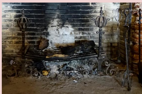
Imagem (s/escala) da peça de mobiliário CSJ CL PM MO 015

Data 31/07/2017 | Atualizado a 31/07/2020