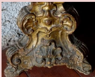
Imagem (s/escala) da peça de mobiliário CSJ CL PM MO 016

Data 31/07/2017 | Atualizado a 31/07/2020