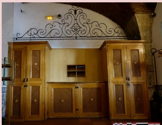
Imagem (s/escala) da peça CSJ CL PM MO 021

Planta interior do edifício Paço Real II (s/escala) - localização do elemento decorativo no interior do Edifício Paço II. (Localização do património móvel aferida a 31/07/2017)