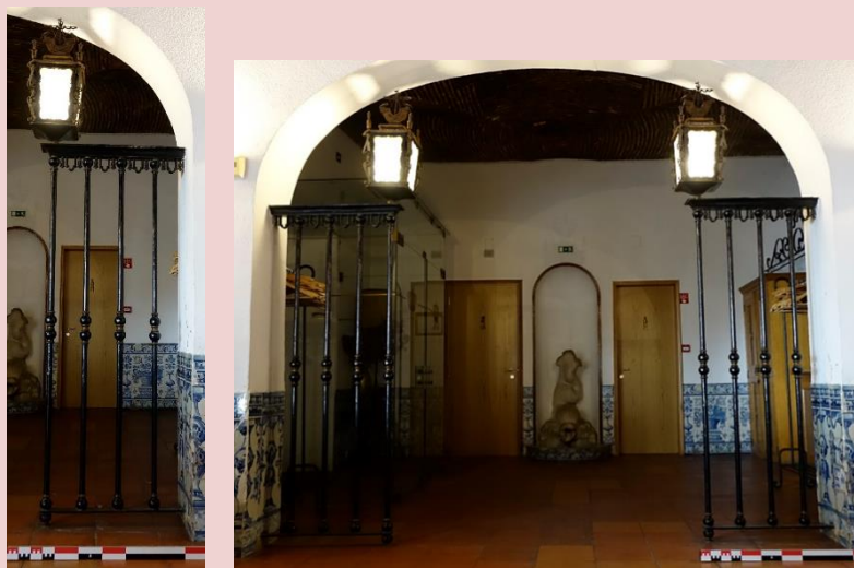
Imagem (s/escala) da peça CSJ CL PM MO 022

Planta interior do edifício Paço Real II (s/escala) – localização dos elementos decorativos no interior do Edifício Paço II. (Localização do património móvel aferida a 31/07/2017)