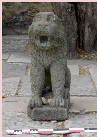
Imagem (s/escala) da estátuas CSJ CL PM ES 025

Data 31/07/2017 | Atualizado a 31/07/2020